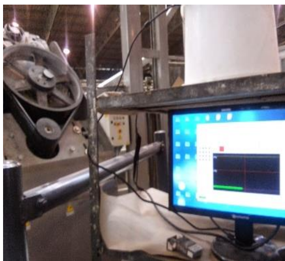
Sistema per mescolatori e mischelatori

Particolarmente idoneo per magazzini di stoccaggi, con catene importanti e trasporti soggetti a sicurezza ( impianti per parchi a tema ) ecc.