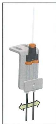
. Gruppo di erogazione