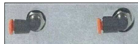
. 2 uscite

. NB Per ulteriori informazioni contattaci direttamente