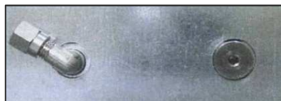
. 1 uscita